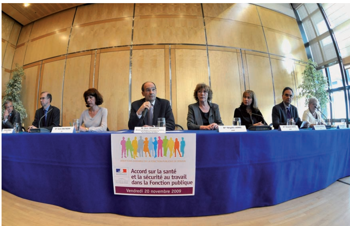
Le ministre, Eric Wœrth, avec des signataires de l'accord, le 20 novembre 2009.

Pour chaque axe, des indicateurs sont établis afin d'évaluer l'atteinte des objectifs fixés.